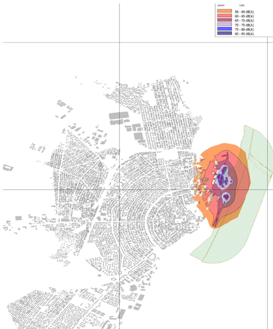
Figura 1. Port Brăila - Harta de zgomot total pentru parametrul Lzsn